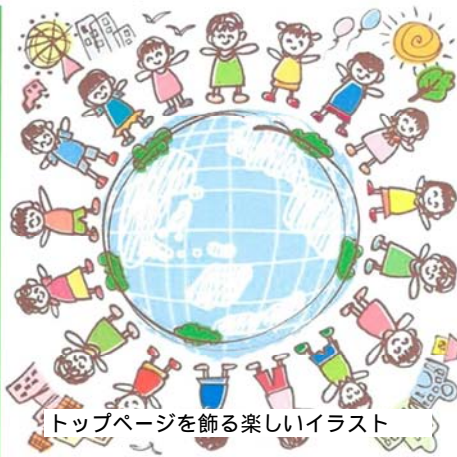
トップページを飾る楽しいイラスト

利用者の意思および人格を尊重して常に当該利用者の立場に立った適切な日中活動の場と福祉的就労の機会を提供します