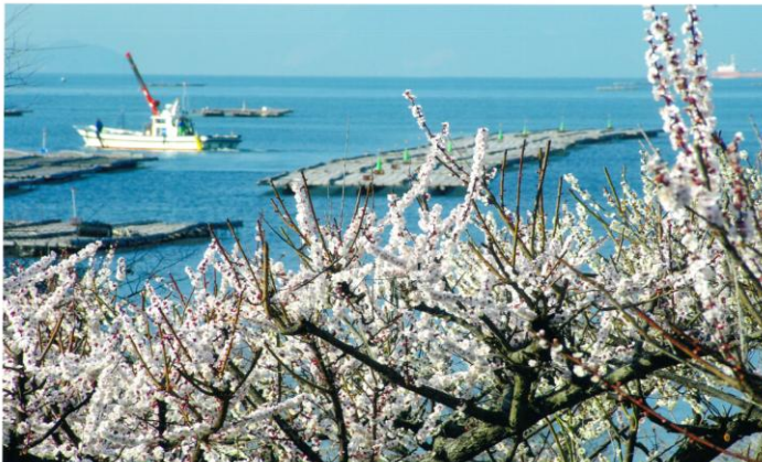
室津大浦海岸の梅林。牡蠣のシーズンは過ぎ、いかなごが解禁になりました。