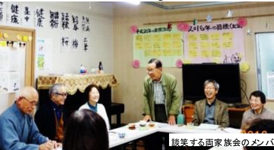
談笑する両家族会のメンバー