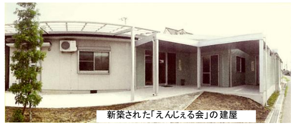
新築された「えんじえる会」の建屋

その後、懇談に入り、なごみ会の皆さんから当事者を抱えての苦しい心の内を忌憚なく話していただき、身につまされる思いがしました。予定の時間を大幅に超え、意見交換