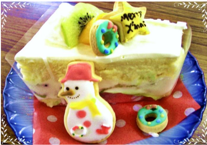
これはもう、いわゆるひとつのアートでしょう! クリスマスの給食にこんなケーキができました!

同時に行われたバザーでは、いつものように“おでん”の店を出しました。吉野家の牛丼バスが来ると聞き、数をセーブしたところ10時半頃までに全部売り切れてしまい、もぉー、大失敗でした!